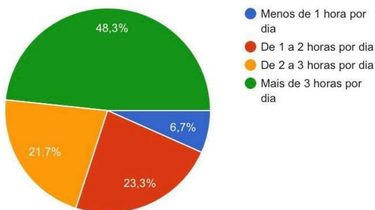
Figura 02- Média diária nas redes sociais