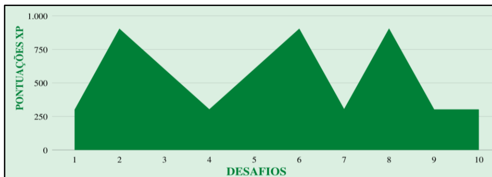
Gráfico 1- Desafios e suas pontuações

O design do jogo calibrou o encadeamento dosando fases de diferentes complexidades com o intuito de não frustrar os jogadores, os mantendo estimulados para avançar no game . No gráfico 1 são mostrados a harmonização entre os dez desafios com suas respectivas pontuações.