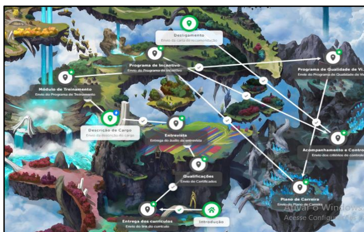
Figura 2 - Fases do Classcraft de Gestão de Pessoas

Durante as reuniões entre o orientador e o grupo foram discutidas as fases da simulação e definida a criação de dez desafios correspondentes às etapas que um funcionário perpassa para iniciar, crescer e desligar-se de uma organização.