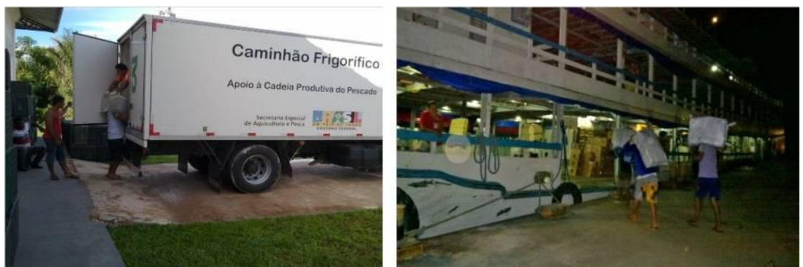
Figura 4: Embarque e Desembarque das Polpas de Frutas em Caminhões e Barco

A logística externa refere-se “[...] a todas as funções dos recursos materiais; compra, armazenamento, distribuição, transporte e informações entre uma ou outra empresa pertencente a complexa estrutura do canal de distribuição.” (Fleury 2000, p. 42). A distribuição das polpas de frutas até seu destino final requer planejamento e cuidados especiais para que o produto chegue até os clientes atendendo com a qualidade e condições adequadas de consumo. A saída da polpa de frutas da agroindústria é transportada num caminhão freezer até o porto da cidade, onde é descarregado no barco que transportará o produto até Manaus-AM. Conforme apresentado na figura 4.