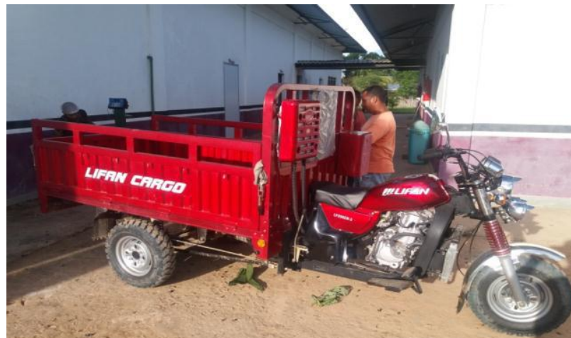
Figura 7: Triciclo utilizado para transporte da matéria-prima.

30 de setembro a 4 de outubro Ponta Grossa - PR - Brasil