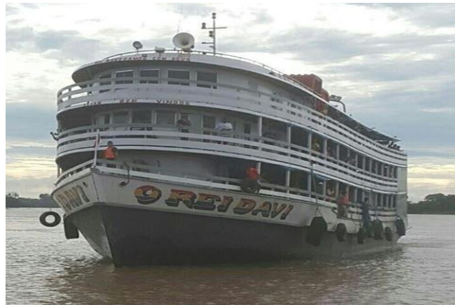
Figura 5: Barcos que transportam as polpas de frutas para Manaus, Amazonas.

Quando a embarcação chega em Manaus os produtos são descarregados em caminhão freezer que transporta até o comprador, que segundo o entrevistado é a Secretaria de Educação do Estado do Amazonas (SEDUC) para fornecimento de merendas escolares da cidade de Manaus-AM, dessa forma o consumidor final são os alunos das escolas estaduais.