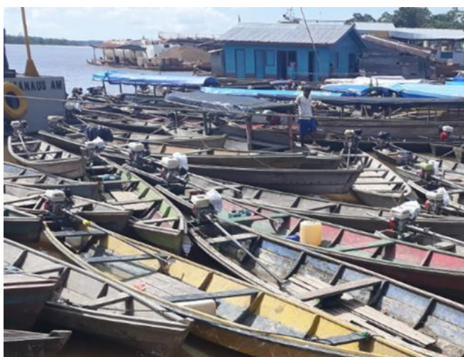
Figura 3: Canoas utilizada para transporte de matéria-prima.

Comunidade de Filadélfia, Comunidade Guanabara I, entre outras. Após a colheita ou coleta das frutas realizadas pelos trabalhadores rurais em suas propriedades, os frutos são organizados para serem transportados até a cidade de Benjamin Constant. Para transporte utilizam suas próprias embarcações, canoas 2 , onde as frutas são armazenadas e transportadas por via fluvial até o porto da cidade.