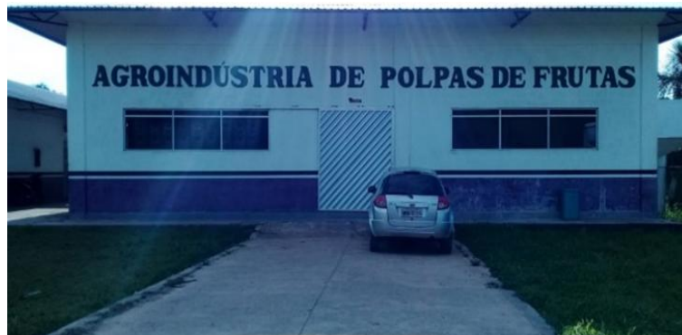
Figura 1: Fachada da Agroindústria de Polpas de Frutas

Com o nome fantasia de Agroindústria de Polpas de Frutas Wotüra, razão social MEGAV INDÚSTRIA DE POLPAS DE FRUTAS DA AMAZÔNIA – LTDA, a fábrica iniciou suas atividades em 2010 produzindo polpas de abacaxi, açaí, buriti, camu-camu e cupuaçu. A Figura 2 mostra a entrada principal da Agroindústria Wotüra, local onde é recebida a matéria-prima para ser processada, onde também é realizada a saída para distribuição dos produtos finais (polpas).