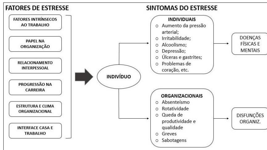
Figura 1 – Modelo Dinâmico de estresse ocupacional

agentes estressores no ambiente de trabalho e que podem gerar sintomas individuais e/ou organizacionais em cada um dos casos.