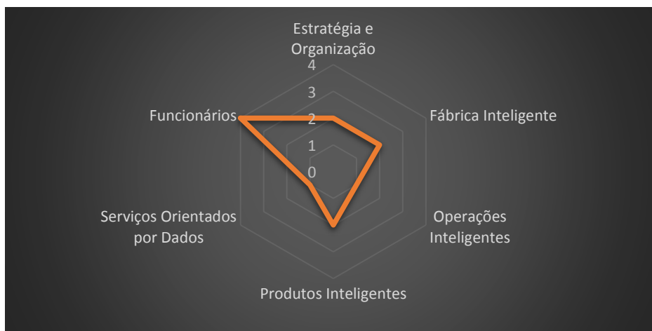
Gráfico 1. Nível de Maturidade da Indústria 4.0 da IMBEL por dimensões. Fonte: elaboração própria a partir dos dados de pesquisa, 2019.

Ao analisar as seis dimensões de maturidade da IMBEL, verifica-se que numa escala de 1 a 5, a empresa obteve as seguintes médias: E&O=2, FI=2, OI=1, PI=2, SOD=1, F=4, ilustradas no gráfico 1, elaborado no Software Excel ®.